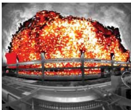
Produzione di coke: le aree calde che non sono state raffreddate a sufficienza sono immediatamente individuate dal sistema PYROsmart. Grazie all'abbinamento con un sistema di monitoraggio antincendio, le zone troppo calde possono essere raffreddate tempestivamente.

"PYROsmart è anche in grado di gestire l'esatta quantità di acqua richiesta, senza sprechi e solo sulle zone che lo richiedono. Esattamente il contrario di ciò che accade normalmente, quando viene mandata una persona a raffreddare la catasta di coke con acqua".